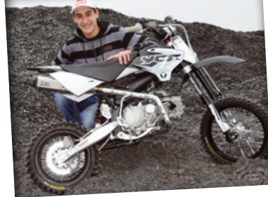
MARVIN MUSQUIN CHAMPION DU MONDE MX2 2009